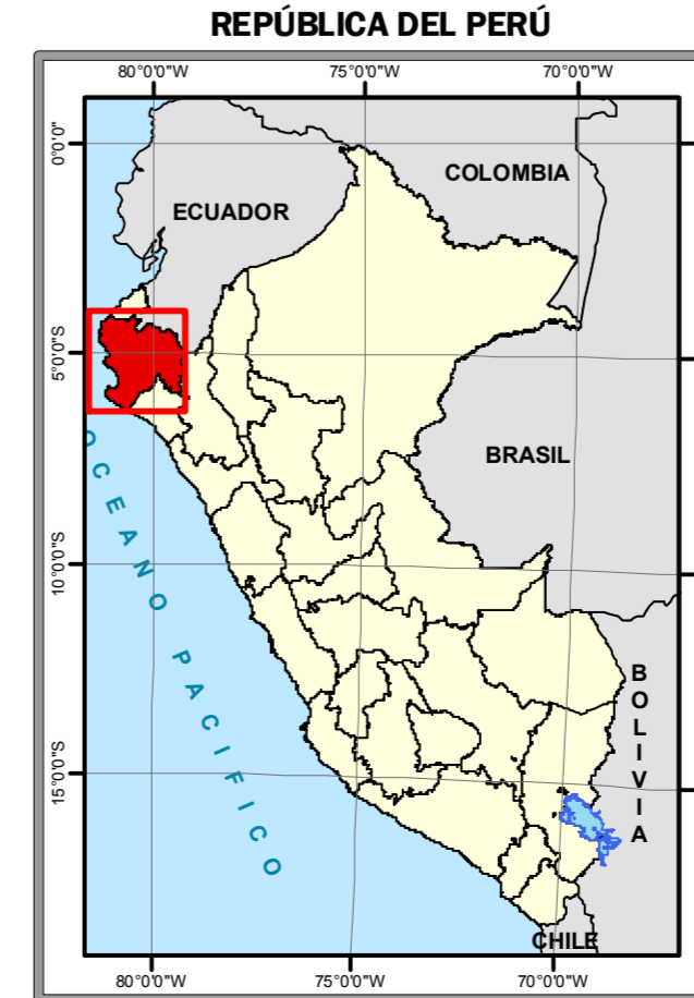
CARTAS NACIONALES QUE CUBREN LA REGION DE PIURA