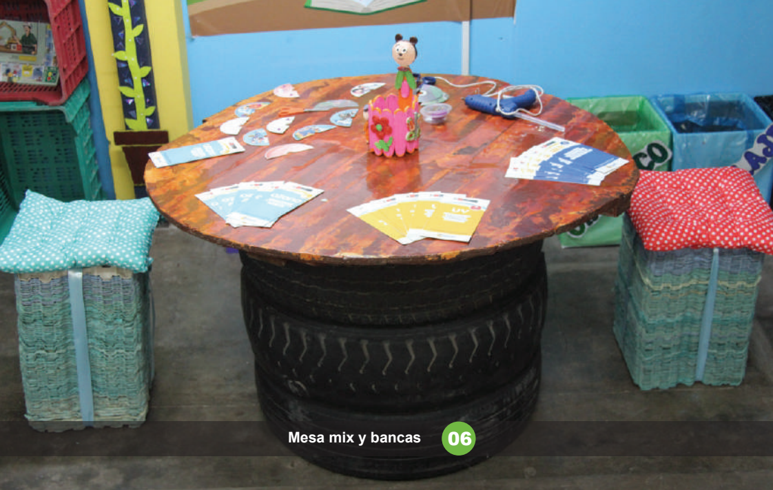
Mesa mix y bancas