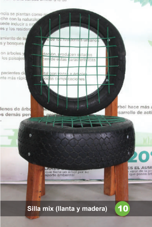
Silla mix (llanta y madera) 10