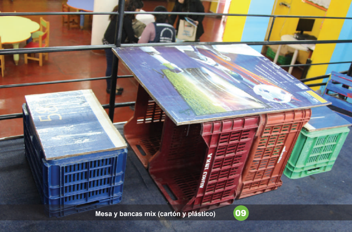
Mesa y bancas mix (cartón y plástico)