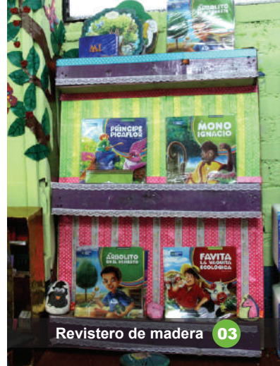
Revistero de madera 03

01 Elaborado con 10 jabas de madera para fruta y acabado con pintura mate.