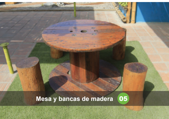
Mesa y bancas de madera 05