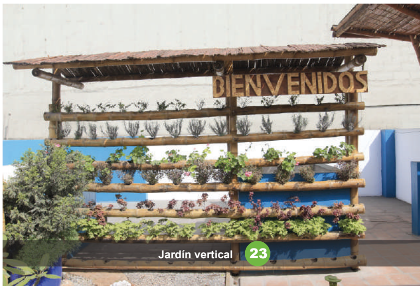
Jardín vertical 23