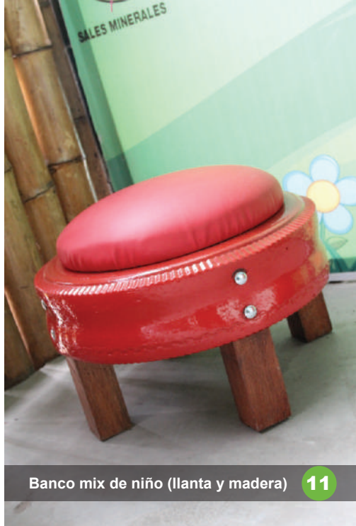
Banco mix de niño (llanta y madera) 11