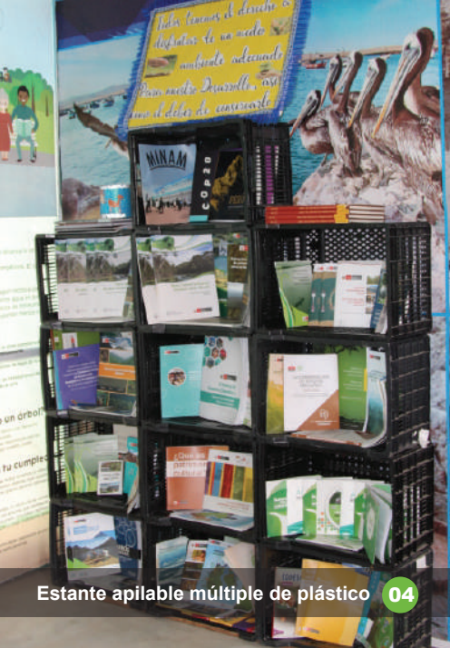
Estante apilable múltiple de plástico 04