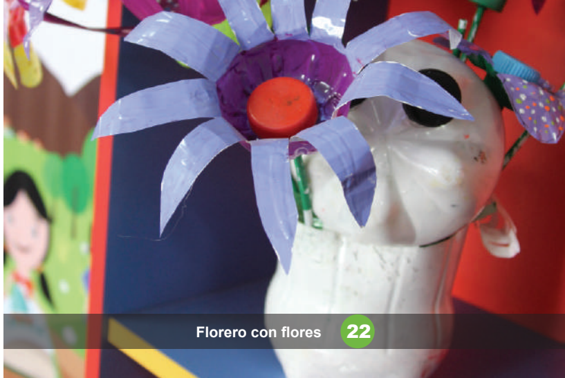
Florero con flores 22