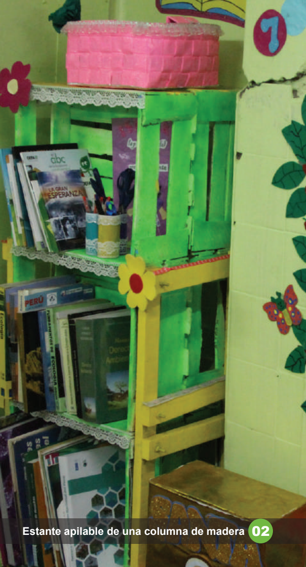
Estante apilable de una columna de madera 02