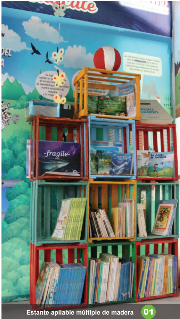
Estante apilable múltiple de madera