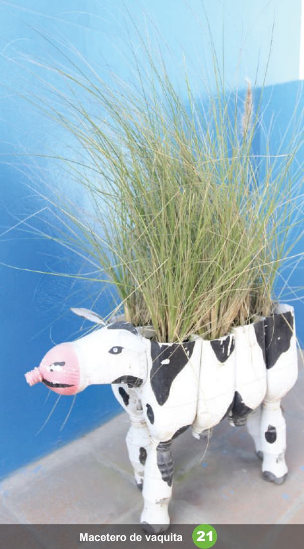
Macetero de vaquita