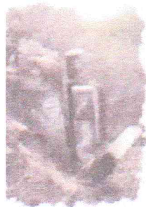
Ruinas Naranja de Guayaquil