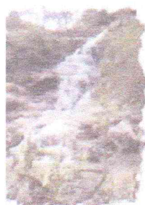
Cataratas Naranja de Guayaquil

E-mail: alcaldia@munifrias.gob.pe Pag. Web: www.munifrias.gob.pe