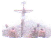
Celebración Semana Santa