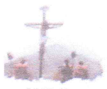
Celebración Semana Santa